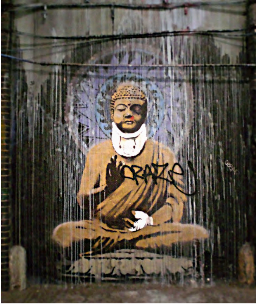
Buda con collarín