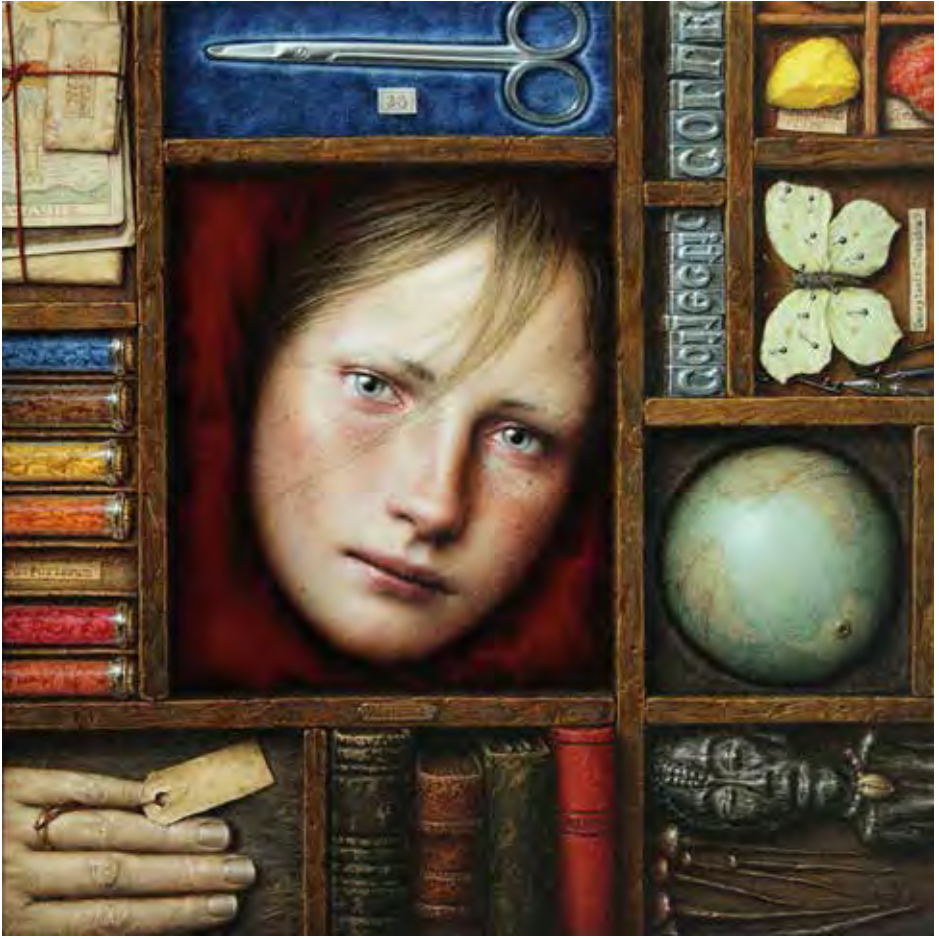
COLLECTIO | Óleo / tabla | 35 x 35 cm. | 2011