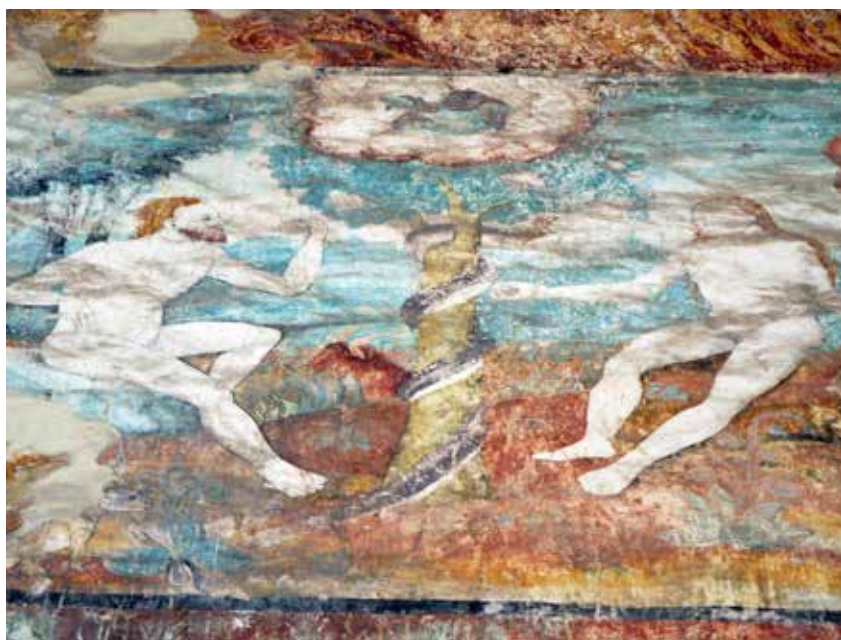
Actopan, 2010