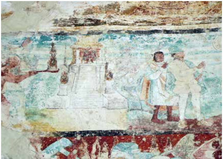
Actopan, 2010, Fotografía del autor.