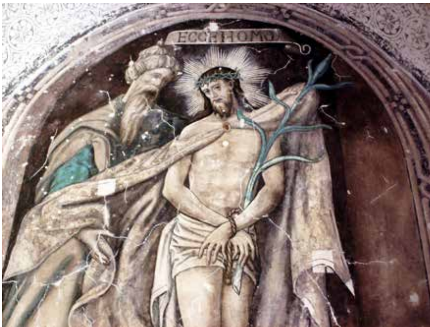
Epazoyucan, 2010, Fotografía del autor.