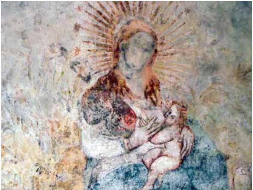
Acolman, 2010, Fotografía del autor.